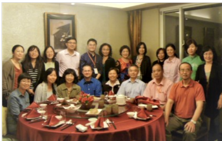
2011年10月 台大校友會館

A: SCSL充分運用網路工具，如E-mail 討論群、微信群組與Line群組等網路社交媒體即時與會員互動，在專業與生活上皆可獲得會員朋友的協助與分享。SCSL每年組織在AAS年會期間的年會，在中國舉辦的學術會議與書展研討會，並組團參加海外圖書館學術活動，促進國際學術交流合作，充實專業知識，增進同道情誼，便利順便返鄉探親。