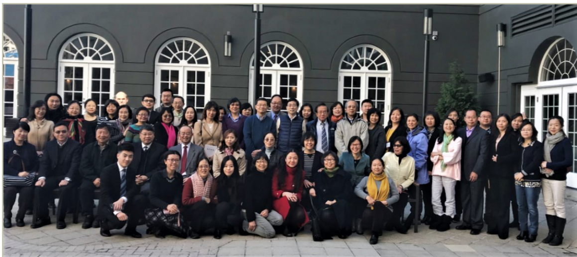
左上：2010年 费城 / 右上及下方：2018年 华盛顿特区